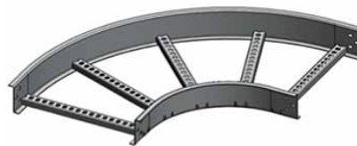
Curva Horizontal a 90°